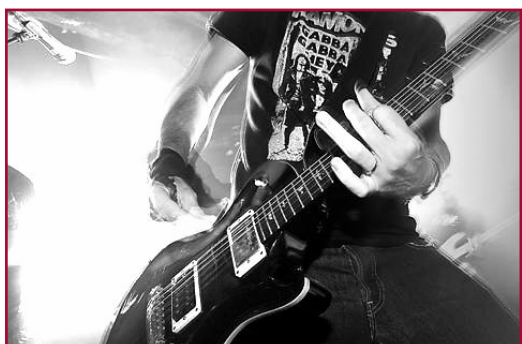
MJC - Vendredi 16 décembre à 21h Tarif : 1 jeu, jouet état neuf (pas de peluche) ou 5 € - Renseignements : 02 32 43 00 89 ou sur www.mjcbernay.fr