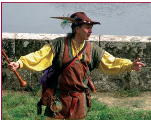
Médiathèque - Vendredi 9 décembre à 20h30 - Gratuit sur réservation - Tout public dès 6 ans