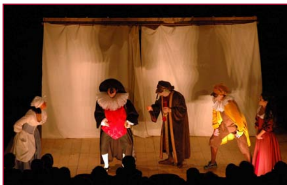
Théâtre Edith Piaf - Vendredi 2 décembre à 20h30 - Tarifs : 9 / 3 €